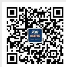
天府新职场公众号